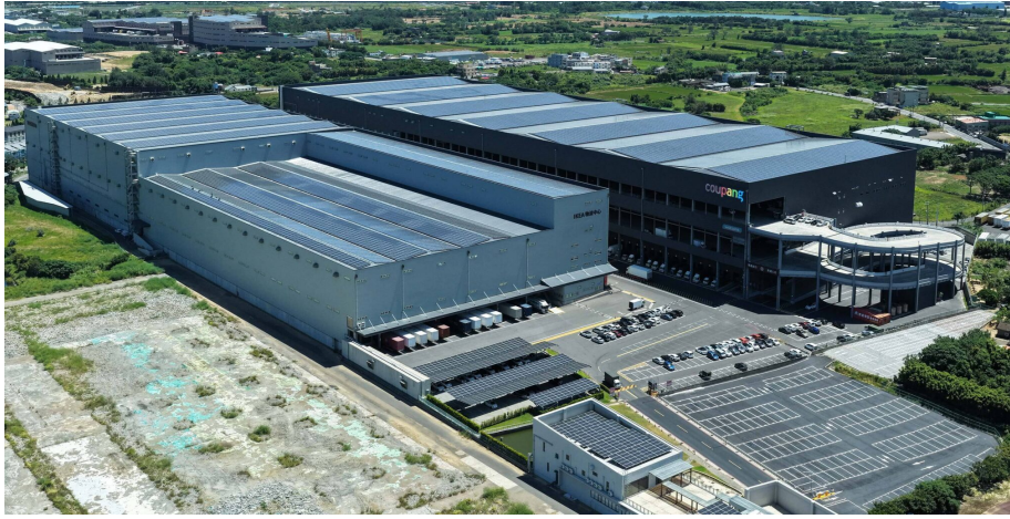
Coupang 酷澎於2026 年在台啟用第四座智慧倉儲物流中心，此佈局不僅是在台的重要投資，亦創造超過3,000個在地就業機會

Coupang 酷澎持續深耕台灣布局，2026 年在台啟用第四座以科技驅動的倉儲物流中心，進一步提升台灣顧客「WOW」的購物體驗；「火箭速配」服務範圍已覆蓋台灣約 70% 的地區，提供最快隔日到貨服務。Coupang 酷澎採分階段擴大對台投資，去年度獲准的投資案為該年度在台規模最大的美國投資案，並於整體外資核准案中名列第二。