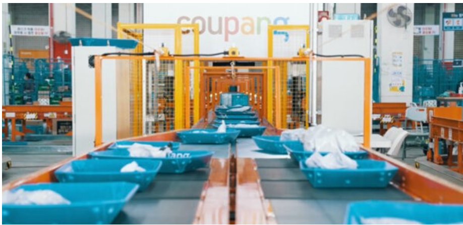
Coupang은 고객 중심의 서비스를 제공하는 데 중점을 두고 있습니다.